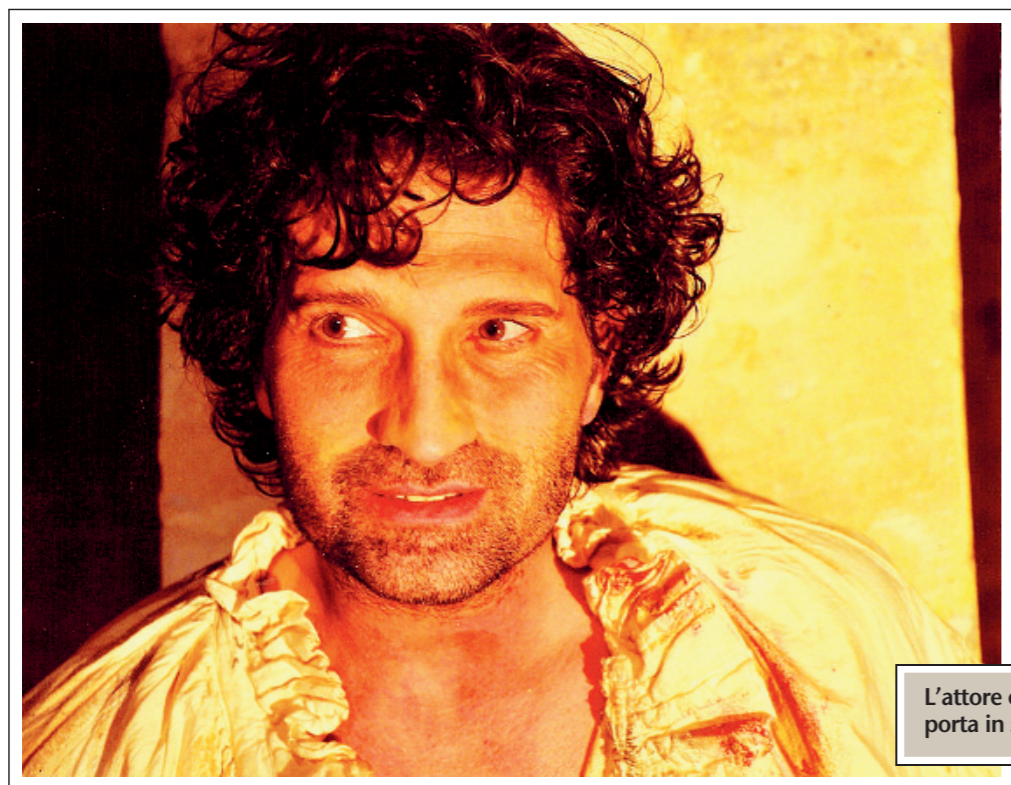
L'attore e drammaturgo Cesare Capitani porta in scena questa sera «Io, Caravaggio»

«Lo ammiro perché diceva quello che pensava ed era un perfezionista: spero, in questo, di assomigliargli»