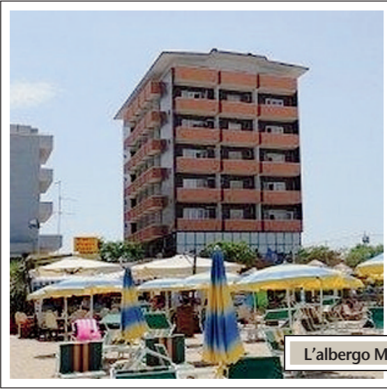
L'albergo Mosè sottoposto ieri a sequestro e chiusura