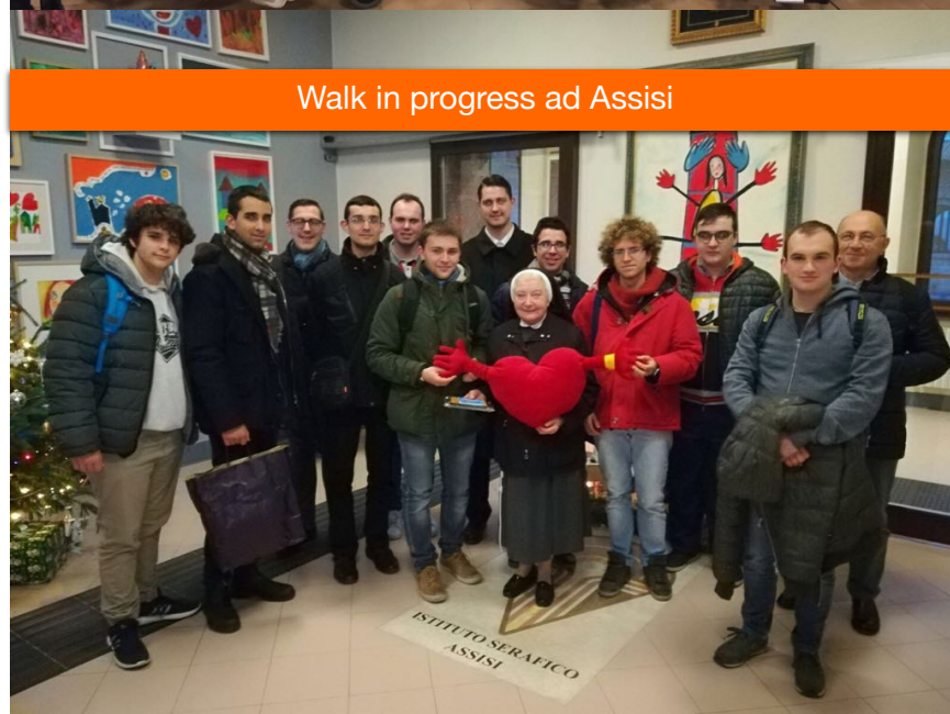
Walk in progress ad Assisi