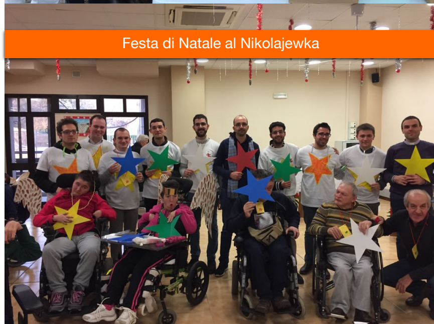
Festa di Natale al Nikolajewka