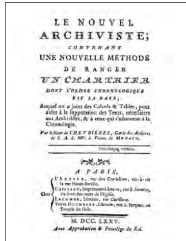
«Le nouvel archiviste», di J. Chevrères (1775)