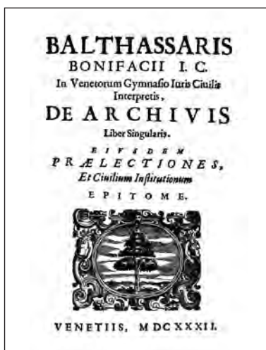
«De Archivis», di Baldassarre Bonifacio (1632)

Offro alla benevolenza dei lettori queste poche pagine, perché essi possano avere a portata di mano un'immediata panoramica, notizie di spedita lettura, a livello divulgativo, di questa tematica; notizie che si trovano ampiamente e approfonditamente trattate in manuali conosciuti e diffusi, come, per ricordare i più conosciuti, il Casanova, il Brenneke, il Lodolini.