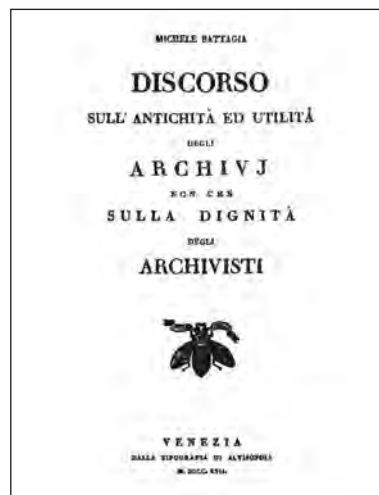
«Discorso sugli Archivi», di M. Battaglia (1817)