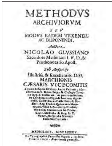
«Methodus Archivorum», di N. Giussani (1684)